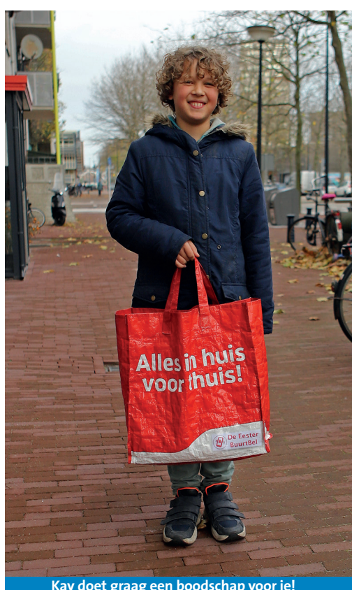
Kay doet graag een boodschap voor je!

'Sommigen wel, sommigen niet. Maar in mijn klas zijn we fanatiek. Daar zamelen we twee keer per jaar spullen in voor de voedselbank omdat een moeder van een klasgenoot daar werkt.'